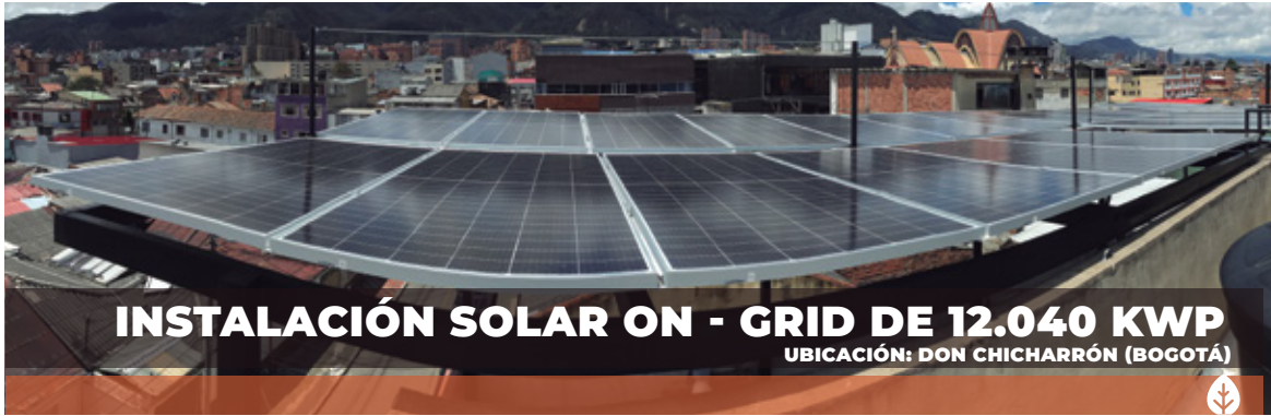
INSTALACIÓN SOLAR ON - GRID DE 12.040 KWP UBICACIÓN: DON CHICHARRÓN (BOGOTÁ)