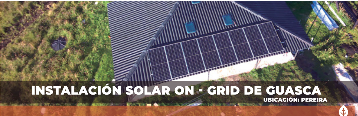
INSTALACIÓN SOLAR ON - GRID DE GUASCA UBICACIÓN: PEREIRA